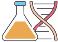
Ciencias de la salud