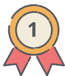
Líder de la semana