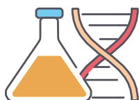
Ciencias de la salud