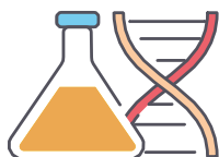
Ciencias de la salud