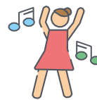
Música y Danza